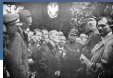
Wawrzyńiec Hajda wita Gen. Szeptyckiego