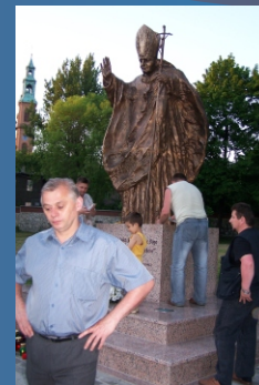
Dzień przed poświęceniem