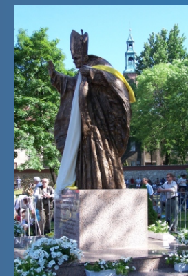
W dniu święcenia pomnika