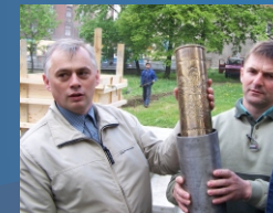
Piekary Śl. - Zalanie kapsuły w fundamentach