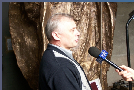
Gliwice - Gotowa rzeźba w odlewni