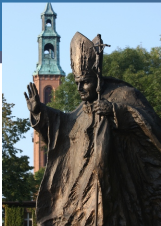
Zobacz jak powstał pomnik w 2005 r.