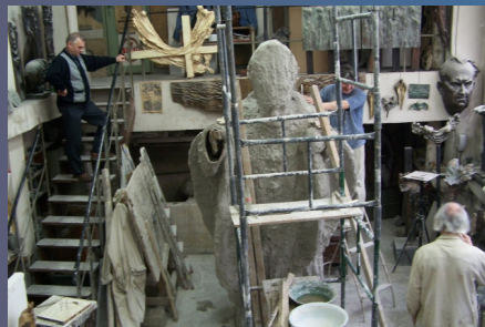
Katowice - Powstaje rzeźba do odlewu