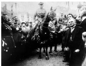
Jak dzisiaj może powstać pomnik Wawrzyńca Hajdy